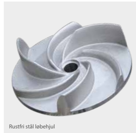
Rustfri stål løbehjul