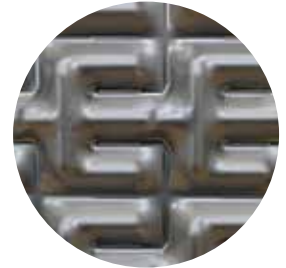
Free Flow plade

SonFlow's Free Flow varmevekslere er ideelle til brug ved behandling af spildevand. De dybe kanaler uden kontaktpunkter giver plads til, at selv komplekse medier med høj viskositet kan strømme uhindret. Vores Free Flow-plader er udformet med et unikt mønster, der minimerer risikoen for tilstopning.